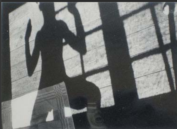
Piet Zwart, Ginnastica, 1930, fotografia, stampa originale d'epoca

Dopo le rassegne dedicate a Otto Hofmann e a Ghitta Carell, inaugurate nel mese di ottobre, il prossimo appuntamento è il 9 novembre con Mario Dondero . In occasione dell'anniversario della caduta del Muro di Berlino, viene infatti aperta al pubblico a Palazzo Ducale la mostra dedicata a questo originale rappresentante del fotogiornalismo contemporaneo che racconta, con gli scatti esposti, la Berlino del periodo immediatamente precedente e subito dopo la caduta. Accanto a Dondero, Palazzo Ducale e i Musei civici ospitano altri interpreti della fotografia del Novecento, da Henri Cartier-Bresson, che ci restituisce immagini intense di Mosca durante la Guerra fredda, a Elio Luxardo, l'artista conosciuto soprattutto per i suoi ritratti delle star del cinema italiano.