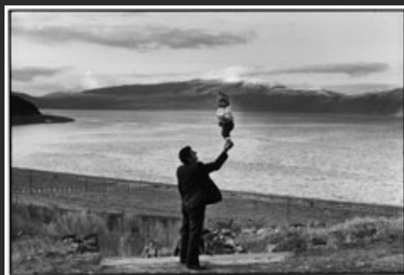
Armenia. Unione Sovietica. 1972