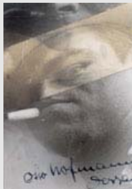
Otto Hofmann, Autoritratto, 1929, fotocollage

Palazzo Ducale Appartamento del Doge 16 ottobre 2009 14 febbraio 2010